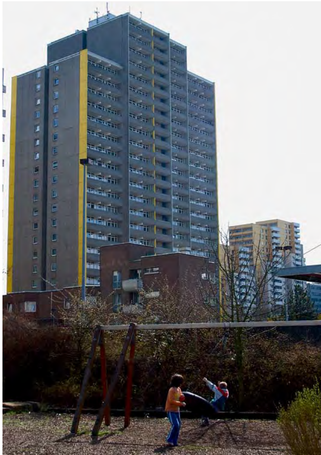
Kinderarmut: Leben am Rand der Gesellschaft.

Mit großer Besorgnis stellt der DPWV fest, dass die Kinderarmut in Deutschland schneller steigt als im Schnitt der Bevölkerung. Eine Studie des Kinderhilfswerks der Vereinten Nationen (UNICEF)