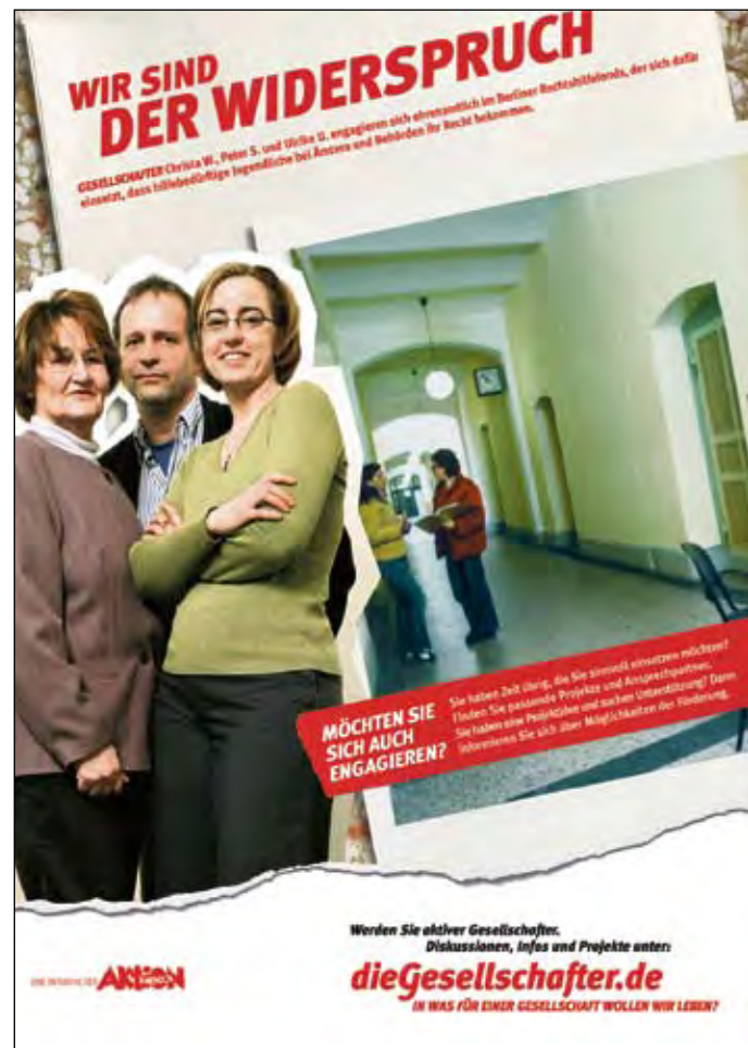
Ein Beispiel für bürgerschaftliches Engagement: das Projekt Berliner Rechtshilfefonds Jugendhilfe e.V.

Weitere Informationen unter dieGesellschafter.de .