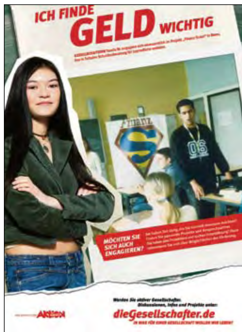
Personen, die sich ehrenamtlich engagieren, stehen im Mittelpunkt einer Serie von Anzeigen im Rahmen des Gesellschafter-Projektes.

mit ganz unterschiedlichen Problemen wenden sich an den Verein: zum Beispiel Minderjährige, die nicht bei ihren Eltern bleiben möchten, Jugendliche, die Unterstützung bei der Berufsausbildung benötigen oder Eltern, die psychologische Hilfen für ihre Kinder beanspruchen. Ein Team von zwei Mitarbeitern übernimmt jeweils die Betreuung eines Falls. Die Mehrheit der 20 Freiwilligen sind Sozialpädagogen, Psychologen und Juristen, die ihre Fachkenntnisse in die Beratung einbringen. Unterstützt werden sie durch ein breites Netzwerk von Fachleuten, die in Problemfällen hinzugezogen werden können. Die Beratung erfolgt ganz individuell. Manchmal muss