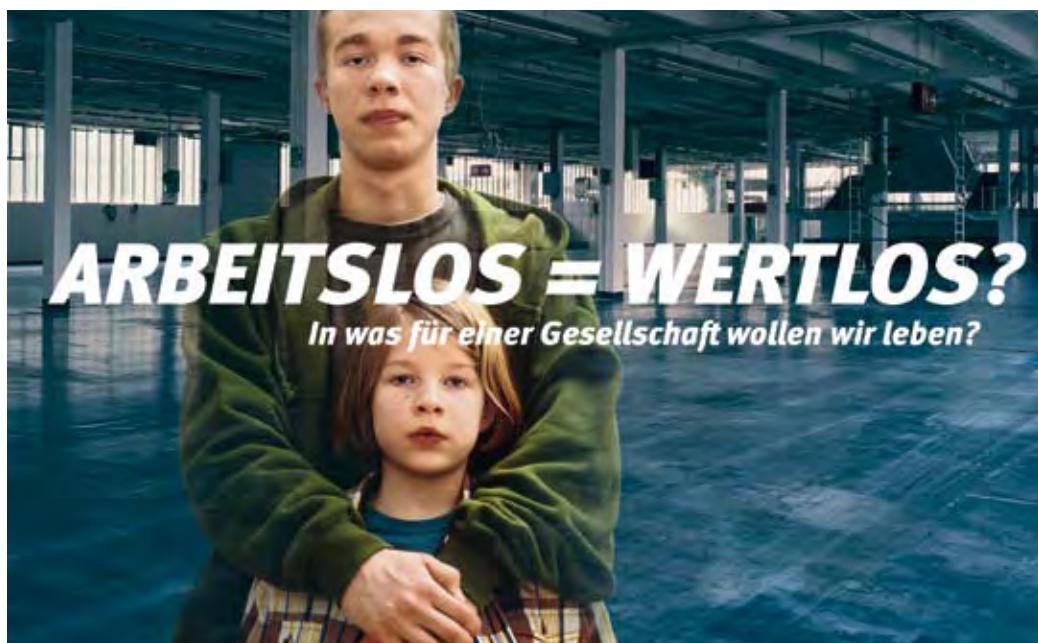
Das Gesellschafter-Projekt fordert dazu auf, sich als aktiver „Gesellschafter“ zu verstehen. Im Mai startet die zweite Projektphase.

„Die Frage nach der Zukunft unseres Gemeinwesens gehört in die Mitte der Gesellschaft“, erklärt Markus Schächter, Vorsitzender der Aktion Mensch und Intendant des ZDF zum Start des Projektes. Nicht die Frage, in was für einer Gesellschaft Menschen leben müssen oder sollen, dürfe die Zukunft des Zusammenlebens in einer Demokratie bestimmen, sondern die Frage, in was für einer