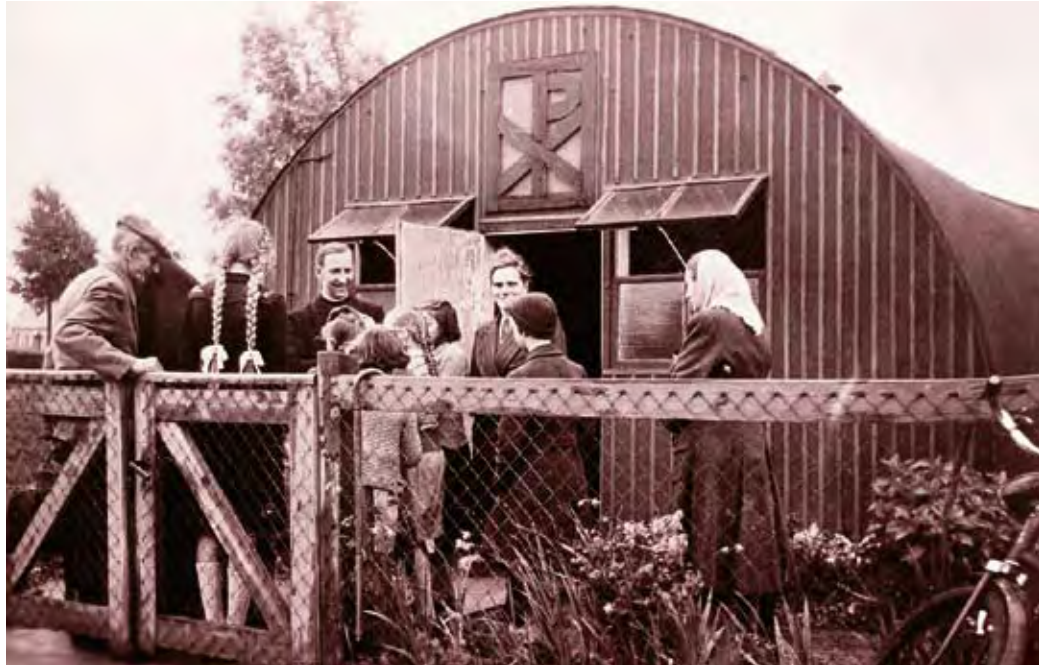
Sonntagsgottesdienst im Flüchtlingslager: katholische Notkirche aus Wellblech in Norddeutschland.

Über den aktuellen Diskussionen wird leicht vergessen, dass Migration und Eingliederung eine lange Geschichte haben. Seit Beginn der Weltchronik zwingen Kriege und Konflikte, Krisen und Katastrophen Menschen zur Aufgabe ihrer Heimat, stehen Bürger vor der Frage „In was für einer Gesellschaft wollen wir leben?“.